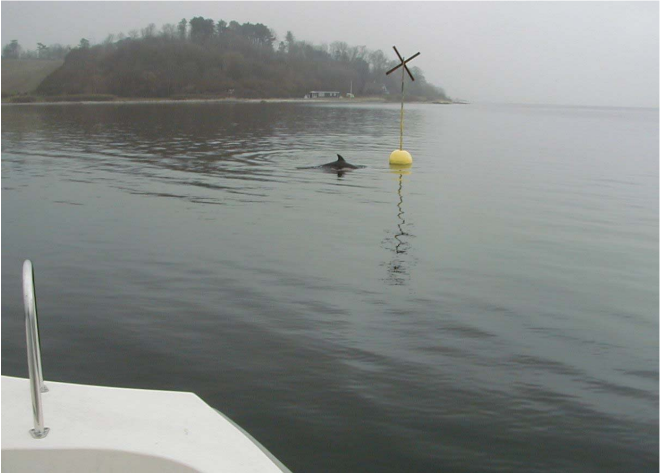
Et syn, der kom til at præge farvandet ud for Børup Sande, sommeren 2005: Delfin ved havbrugets gule specialafmærkning. Foto: Børge Madsen, 14. april, 2004

specialafmærkning ved havbruget midt mellem Skærbæk Havn og Børup Sande. Denne bøjle bliver tilsyneladende det faste holdepunkt i delfinernes tilværelse den næste 12 måned - indtil først i juni, 2004.