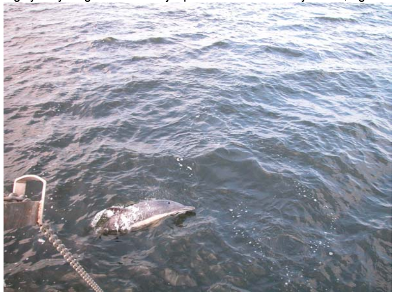
Delfin ved miljøskibet "Thyra"s ankerkæde ud for Skærbækværket. Foto: Erik Pedersen, 7. juni, 2004

hænger fra en bøje ned gennem en ellers tom vandmasse, med en delfins ører må "ses" som en tyk og kraftig kridtstreg på en ellers sort tavle. Et sømærke med kæde og ankerblok vil for en delfin være en markant og "iørefaldende" geografisk lokalitet. Hvad delfinerne så skal bruge et sådan "geografisk fikspunkt" til er uvist.