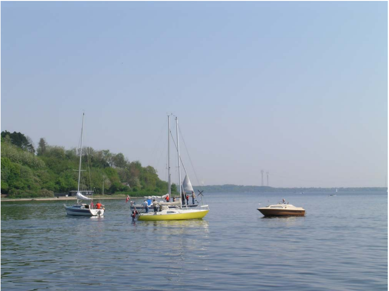
Der var tæt trafik omkring det sorte kryds, sommeren 2004. De sejlene var hensynsfulde, og de mange både syntes ikke at genere delfinerne. Foto: Anders Lind-Hansen, 10. maj 2004.

.... og således forløber sommeren. En af de få variationer sker da Vejle Amts miljøskib "Thyra" d. 7. juni 2003 lader ankeret gå ud for Skærbækværket. Få minutter efter opsøges skibet af en af delfinerne, der tilsyneladende kaster sin kærlighed på ankerkæden.