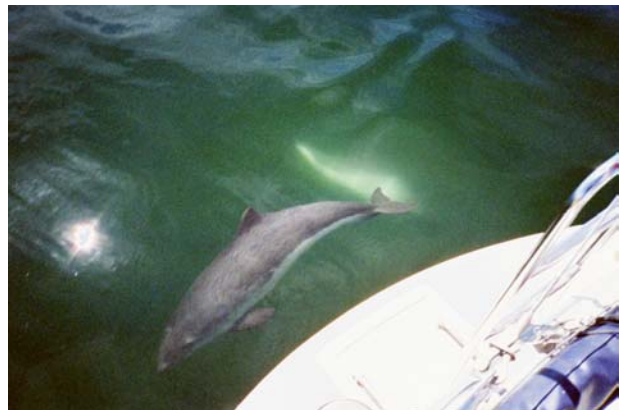
Delfin og marsvin set fra båd ned i vandet.

men sandsynligheden taler for, at det en hest. Man kan nemt se forskel på delfin og marsvin, hvis man er tæt nok på, men det, som helt tydeligt har overbevist de mange observatører om, at det nok ikke var marsvin, har været dyrenes adfærd.