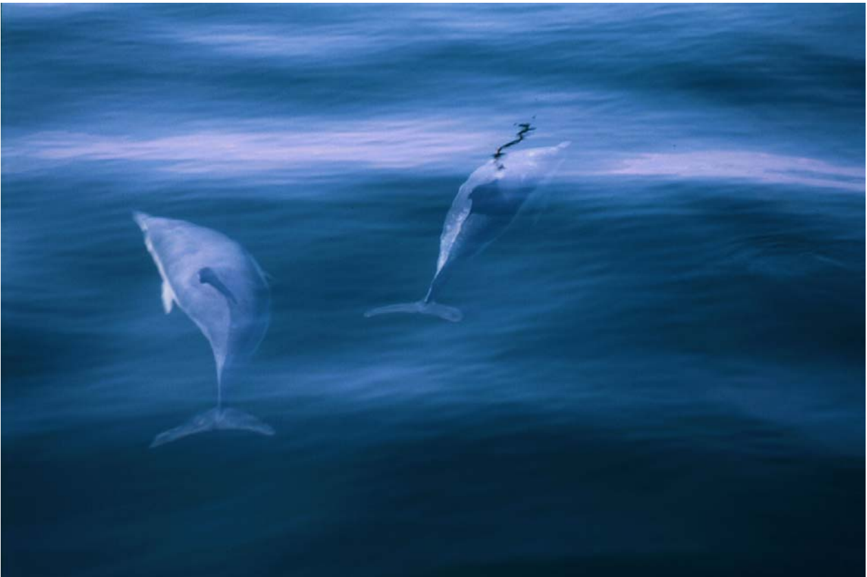
Almindelige delfiner i Øresund d. 15. august 2003.